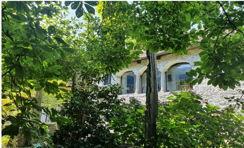
Casa Garzoli "Sotto le Piazze" a Maggia /TI